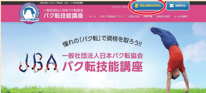
※挿入画像は、全てPCの表示となりますので、携帯電話での表示と多少異なります。

日本バク転協会のホームページ上にあります『検定試験のお申込』をクリックします。 ※他のページにも上記のボタンは配置されています。